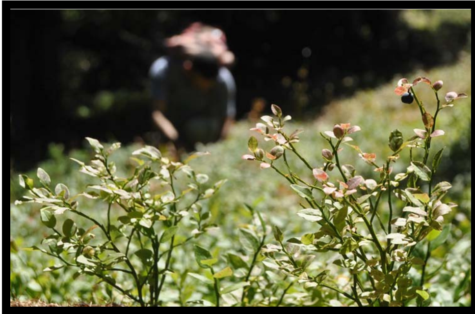
Al lavoro... nella "mirtillaia"!